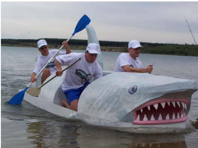
Sieger der Gaudi-Regatta 2008